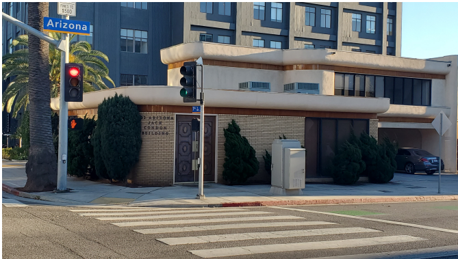
Vistes de l'edifici des de fora

El centre on es realitzaran les classes es troba a una ubicació privilegiada: al veïnatge de Thrid Street Promenade, al centre de Santa Mònica. L'escola ocupa tot un edifici a Arizona Avenue i compta amb una vista pintoresca del centre de la ciutat.